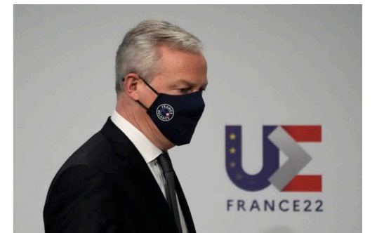
Frankrikes finansminister Bruno Le Maire.

De jobber med å identifisere eiendelene deres i Frankrike og finne ut av hvem som eier ulike bankkontoer, luksurvillaer og yachter. Arbeidet beskrives som komplisert ettersom eiernes identitet kan være gjemt bak mange skallselskaper.