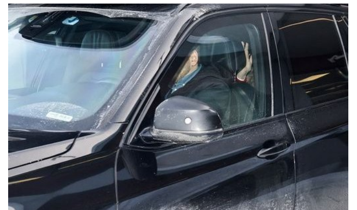
Dronning Sonja vinket til pressen da hun forlot sykehuset i Lillehammer.

Det har ikke lyktes NTB å få kontakt med Slottet søndag formiddag, men byråets fotograf var til stede da dronningen gikk inn i en bil og forlot sykehuset.