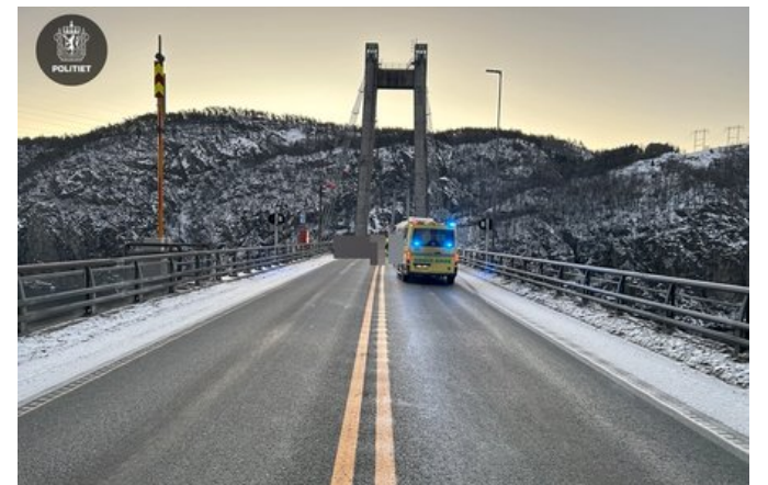
Dødsulykke ved Feda mellom personbil og betongbil.

– Kriminalteknikere ble varslet, og ulykkesgruppen til vegvesenet skal rykke ut. I tillegg skal veien ryddes, så ting vil ta tid, sier Hægeland til VG.